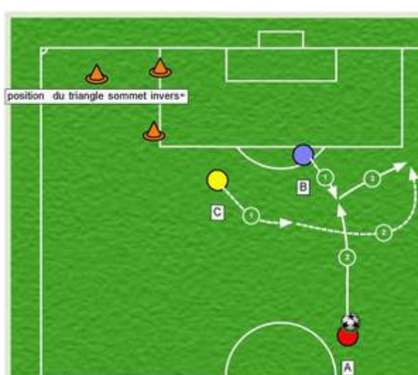
Figure 3 et 4 le triangle de départ est inversé . Aussi bien dans l'insertion de C dans la figure 3 que son déplacement dans le dos de B dans la figure 4 se déroulent en 2 temps.