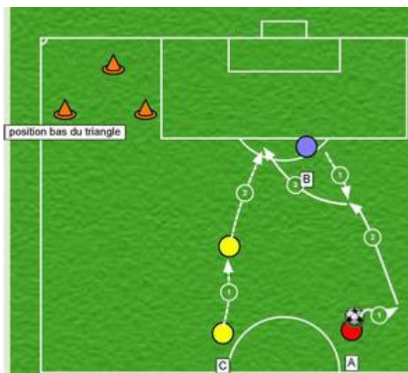
Figure 1 position en bas du triangle L'insertion de C se fait en 2 temps