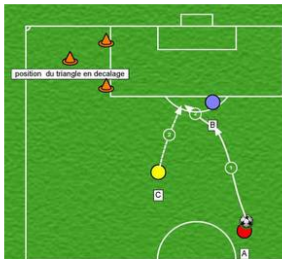
Figure 2 position en décalage dans le triangle L'insertion de C se fait en un temps